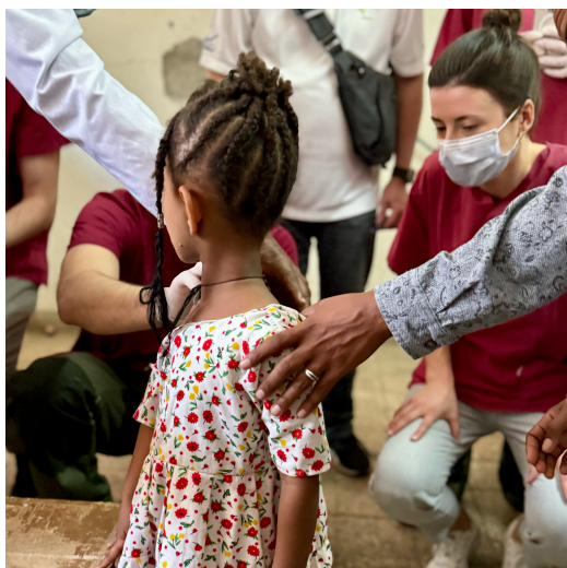
BILD 4: Nicht allen Patienten konnte geholfen werden: Auch orthopädische oder internistische Befunde waren dabei.