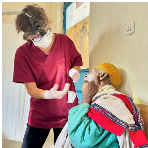
BILD 5: Auch akute zahnmedizinische Patienten waren spontan ans Krankenhaus gekommen in der Hoffnung auf Hilfe.