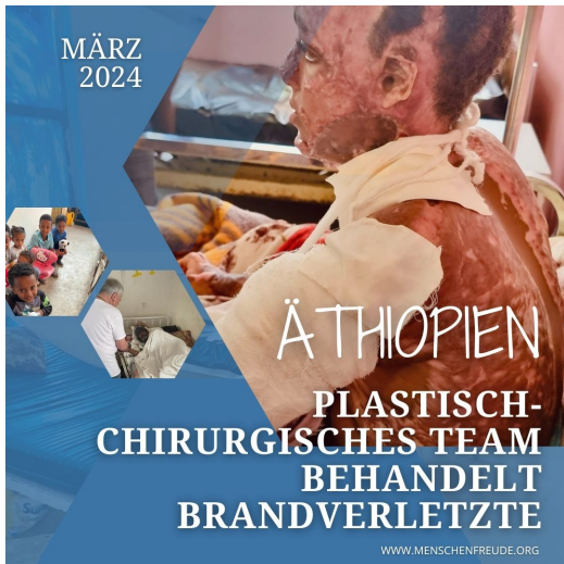
BILD 2: Das erschreckende Bild Verletzungen bewog nicht nur das Menschenfreude-Team zu helfen, sondern auch viele Spender.