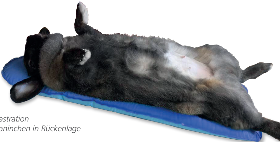
Kastration Kaninchen in Rückenlage