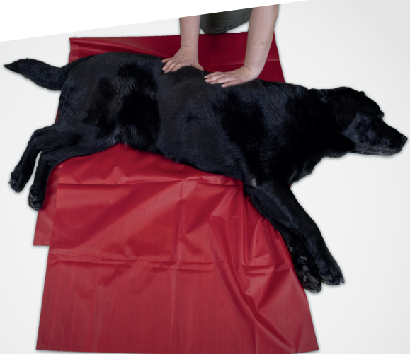
Art.-Nr.: DFS70200X50SP | Slideezi® als patientenbezogenes Einmalprodukt