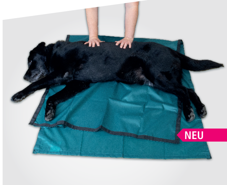
Art.-Nr.: SMS90200SP | Slideezi® als waschbares, wiederverwendbares Gleittuch