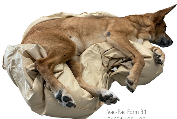
Vac-Pac Form 31 51631 | 90 x 98 cm

Vac-Pac ist eine Vakuum-Matte, die sich an das Tier anlegt und es bei Operationen und anderen Eingriffen sicher in einer festen Position hält. Vac-Pac ist mit festen, winzig kleinen Polystyrolkugeln gefüllt. Die Kugeln haben verschiedene Größen und bilden so eine besonders gut formbare Masse, sobald die Luft aus der Matte abgesaugt wird. Durch das individuelle Anpassen an den Patienten entsteht eine druckentlastende Vergrößerung der Auflagefläche.