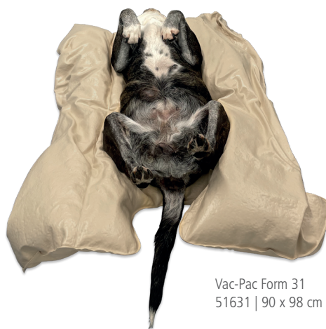
Vac-Pac Form 31 51631 | 90 x 98 cm